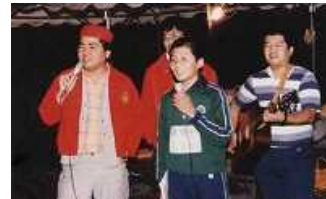
【昭和から平成に時代が変わった頃の文化祭】

私が在学していた頃もそうでしたが、男子は全員坊主頭で通学時には学帽をかぶっていました。体育祭の組体操と音楽祭の一場面。練習を重ねた演技を披露するに当たり、泥水が浮く校庭にためらいもなく俯せる。ジャージや制服は変わっても、こうしたひたむきさが深中生のDNAとして今も引き継がれていることを切に願っています。県内でも珍しい弓道部が深中にはありました。