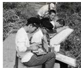
【開校当時の写生会】

では少し視点を変えて、生徒や学校の様子を見てみましょう。…今とは少し違っていました。