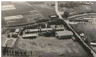
【旧大寄中学校の校舎・校歌】

旧深谷中学校は現在の城址公園に、旧大寄中学校は現在の北部運動公園にありました。どちらの中学校も、第二次大戦後に整備された教育制度の下でつくられた新制中学校として1947年（昭和22年）にいち早く開校し、それぞれの地域の中学校教育を推進してきた伝統校でした。