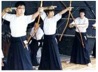
【弓道部の練習風景】

私が在学していた頃もそうでしたが、男子は全員坊主頭で通学時には学帽をかぶっていました。体育祭の組体操と音楽祭の一場面。練習を重ねた演技を披露するに当たり、泥水が浮く校庭にためらいもなく俯せる。ジャージや制服は変わっても、こうしたひたむきさが深中生のDNAとして今も引き継がれていることを切に願っています。県内でも珍しい弓道部が深中にはありました。