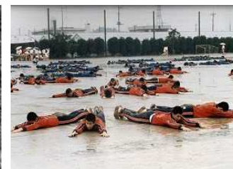
【開校10周年頃の体育祭と音楽祭】