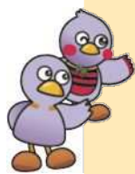
埼玉県マスコット 「コバトン」「さいたまっちゃん」

悩んでいる人に気づき、声をかけられる人のことです。 特別な研修や資格は必要ありません。 誰でもゲートキーパーになることができます。 周りで悩んでいる人がいたら、 やさしく声をかけてみてください。 声をかけることで、 不安や悩みを和らげるにつながります。