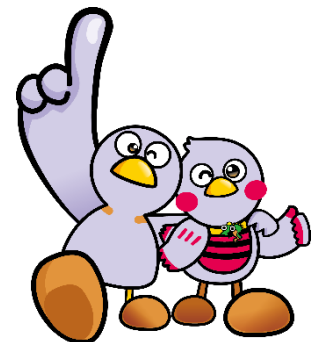
埼玉県マスコット コバトン&さいたまっち

令和7年度入試までの部活動に関する記入箇所（「3 特別活動等の記録」の欄のその他）を 令和8年度入試は、「5 その他」の欄へ変更します。