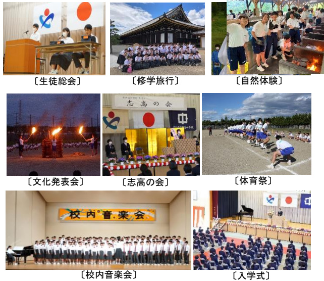
〔生徒総会〕 〔修学旅行〕 〔自然体験〕 〔文化発表会〕 〔志高の会〕 〔体育祭〕 〔校内音楽会〕 〔入学式〕